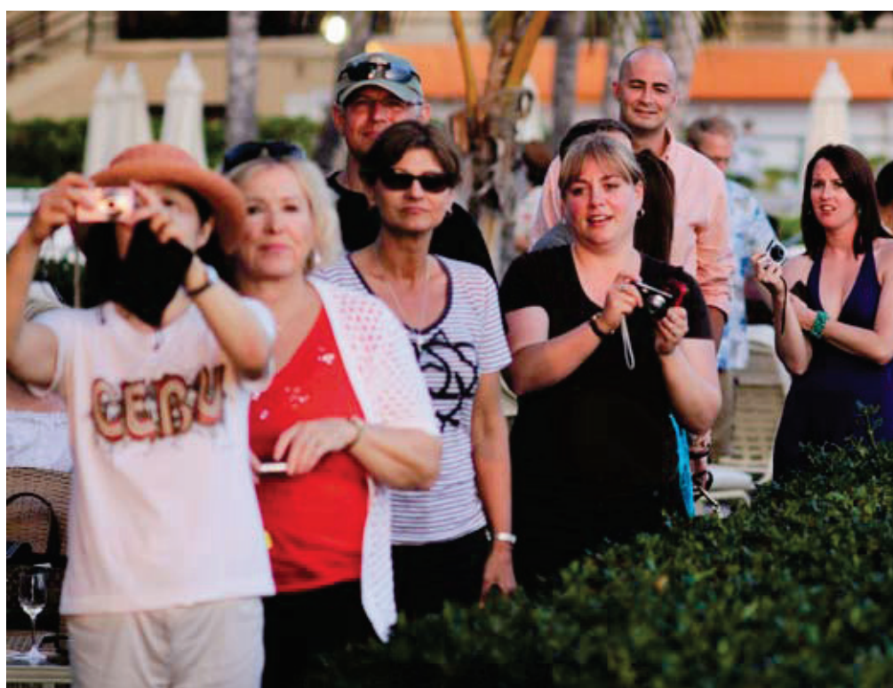
Im Zeitalter der totalen Fotografierbarkeit – viele Urlaubsbilder landen im Netz.