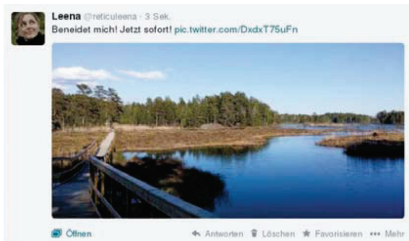
Ein Bild ist schnell gemacht – Und mit ihm oft ungewollt auch Zeit und Ort.

gung, dass man nur davon profitieren kann, wenn man bereit ist auch Userinnen und User am Ergebnis zu beteiligen. Dies muss jedoch explizit klar gemacht werden, indem das Werk mit der entsprechenden Lizenz markiert wird. Um diesen Prozess zu vereinfachen gibt es die sogenannten Creative-Commons-Lizenzen (CC-Lizenzen). Dies ist ein Baukastenprinzip, in dem man sich die eigene Lizenz selbst zusammenstellen kann.