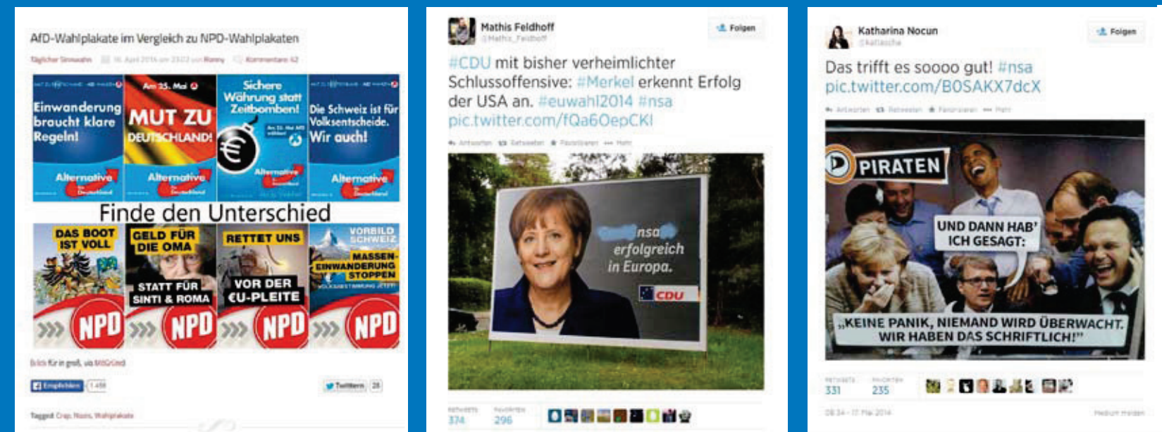
Abb. 1, 2 und 3 – Bildbotschaften als politische Statements im Netz.

Wenn Sie ein Foto machen, ist dieses automatisch urheberrechtlich geschützt, aber dadurch wird auch eine Nutzung durch andere verhindert. Da eine lebendige Kultur weitgehend davon lebt, dass existierende Werke verarbeitet werden, möchten vor allem viele Netzaktive eine weniger restriktive Lizenz für ihre Werke verwenden. Solch eine Lizenz erlaubt beispielsweise einen ausschließlich privaten Gebrauch oder stellt die Bedin-